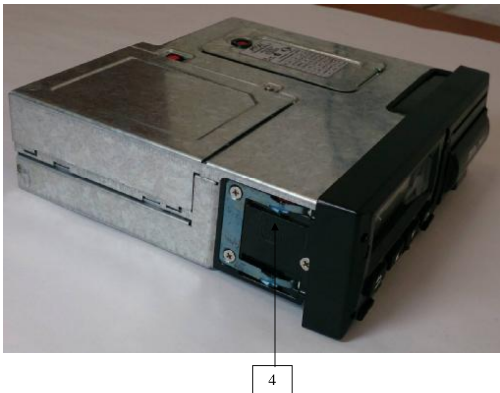
Рис. 2 Место пломбировки батарейного отсека (4) под пружиной фиксатора.