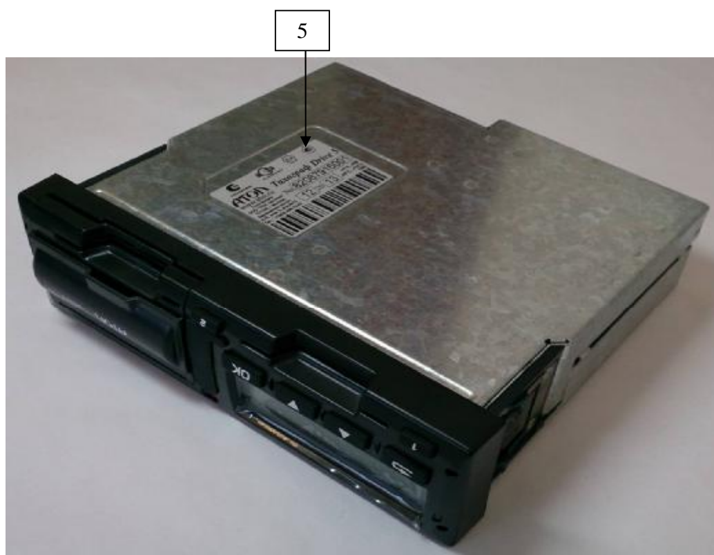
Рис.3 Место нанесения знака утверждения типа (5) на табличке предприятия.