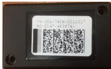
Рисунок 1 – Общий вид блока